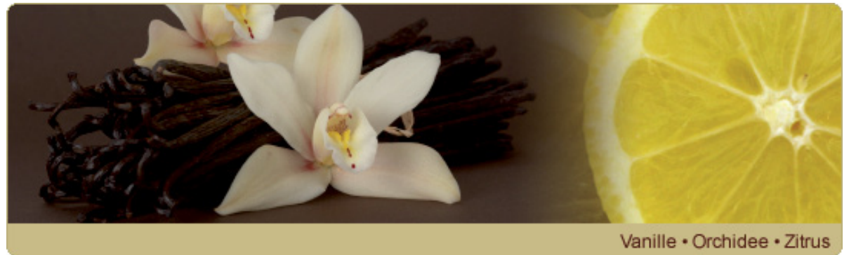
Vanille • Orchidee • Zitrus