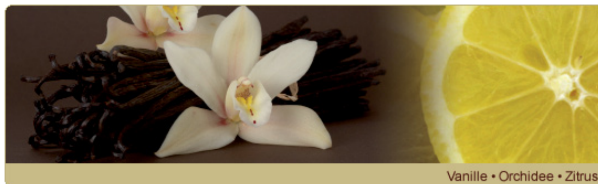
Vanille • Orchidee • Zitrus